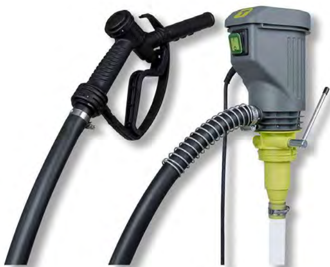
19-1160 sowie 19-1161

- Anschluss an Fassgewinde 2" → passend für unsere Heizöltanks - Heberschutz